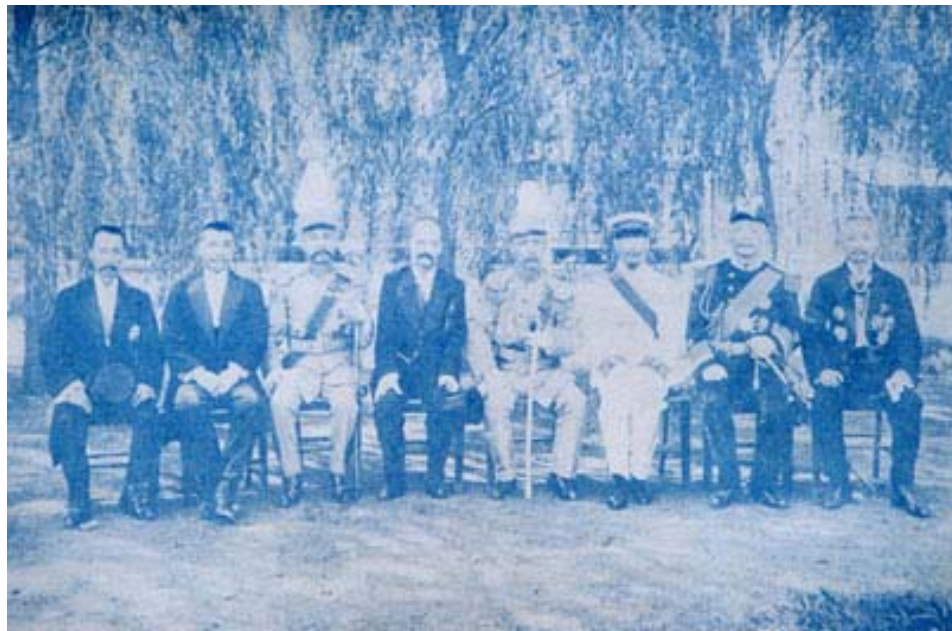
五四前夕的北洋政府主要成員，左起為曹汝霖、劉冠雄、陸徽祥、段祺瑞、錢能訓、段芝貴、朱深、傅增湘