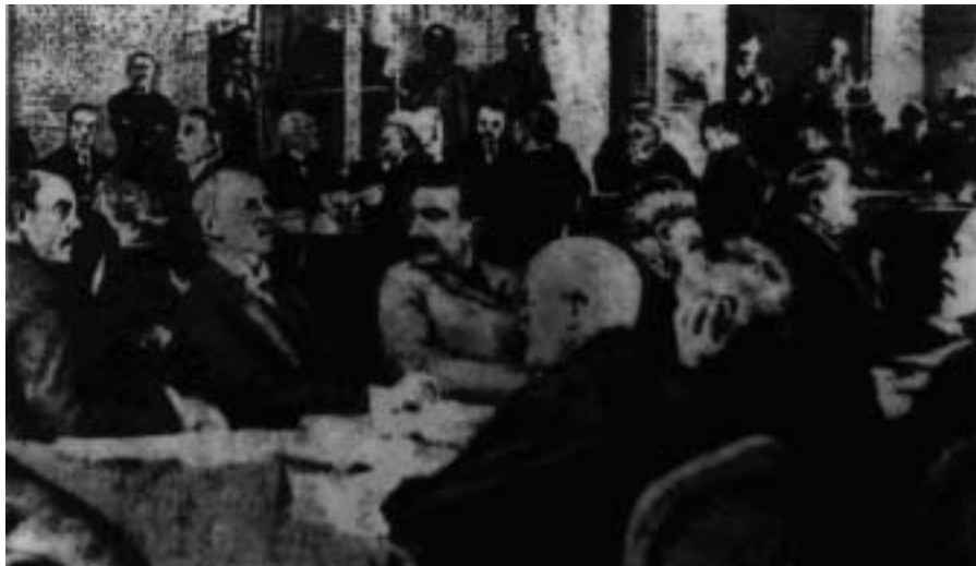
1919 年 5 月

1915 年日本向中國提出「二十一條」要求。1919 年第一次世界大戰結束後，曾參與第一次世界大戰的中國以戰勝國身份出席巴黎和會，國人均希望列強能將原被奪的山東主權歸還我國，豈料列強偏袒日本，作出「山東決議案」，將戰敗國德國在中國山東的利益交給日本，而北洋政府竟然準備在宰割中國的「和約」上簽字。消息傳來，激發起中國民眾的愛國心和反抗列強不平等條約的強烈情緒，中國學生和知識份子得到了民眾的支持，發起了一連串愛國行動，「內懲國賊，外拒強權」，掀起中國現代史序幕的「五四運動」。