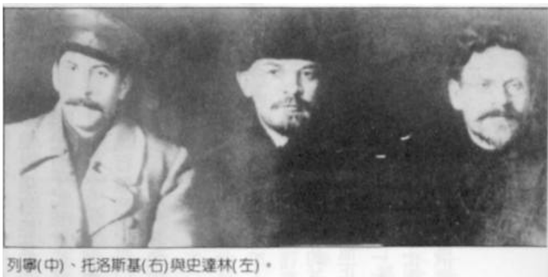
列寧(中)、托洛斯基(右)與史達林(左)。