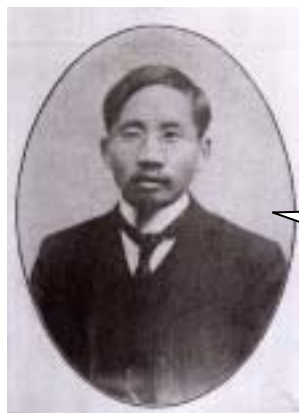
北京大學校長 蔡元培