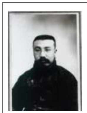
最早期受共產主義 影響的學者