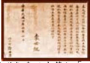
袁世凱與日本簽訂「二十一條」協議書